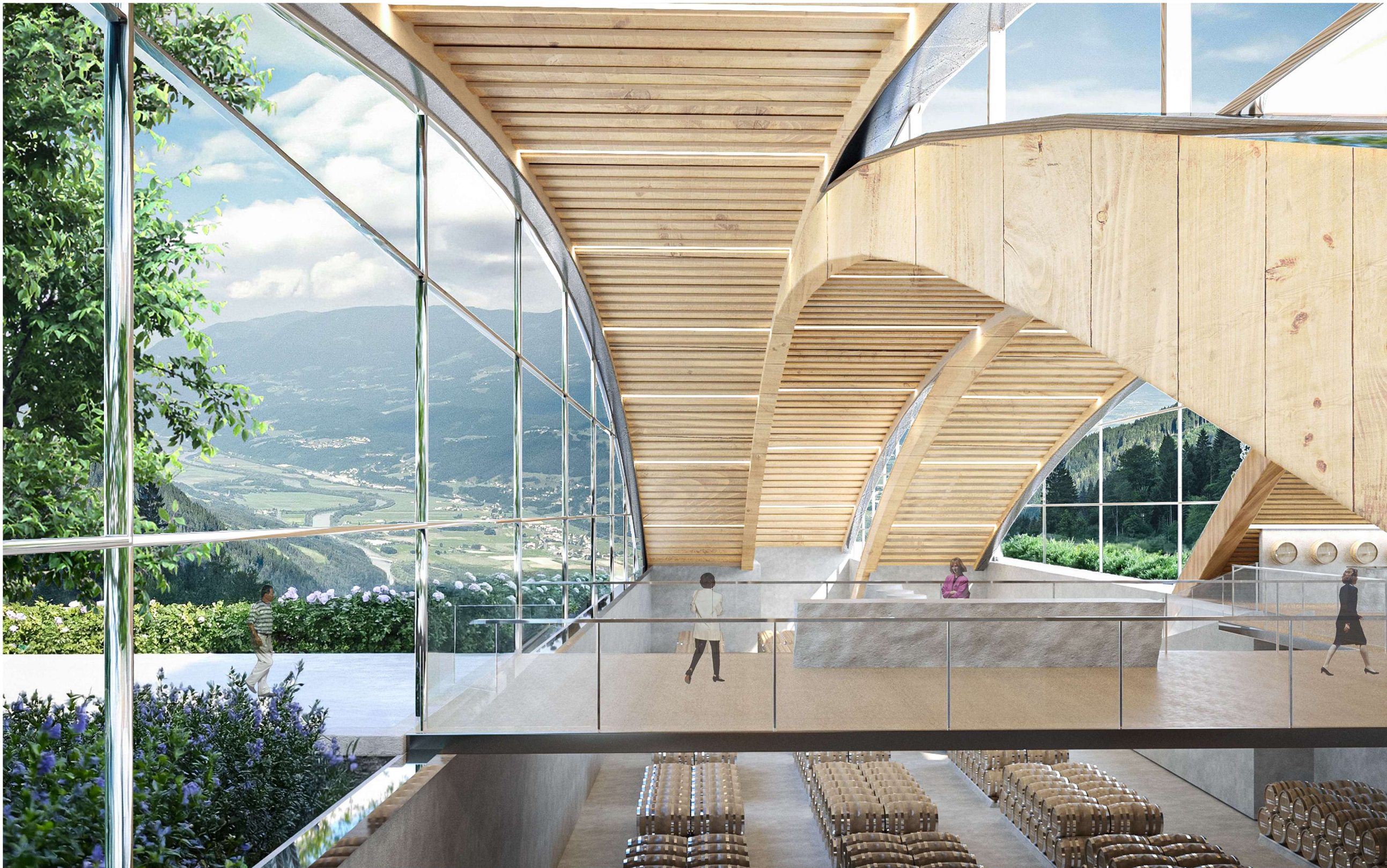
WIZUALIZACJA STREFY WEJŚCIA