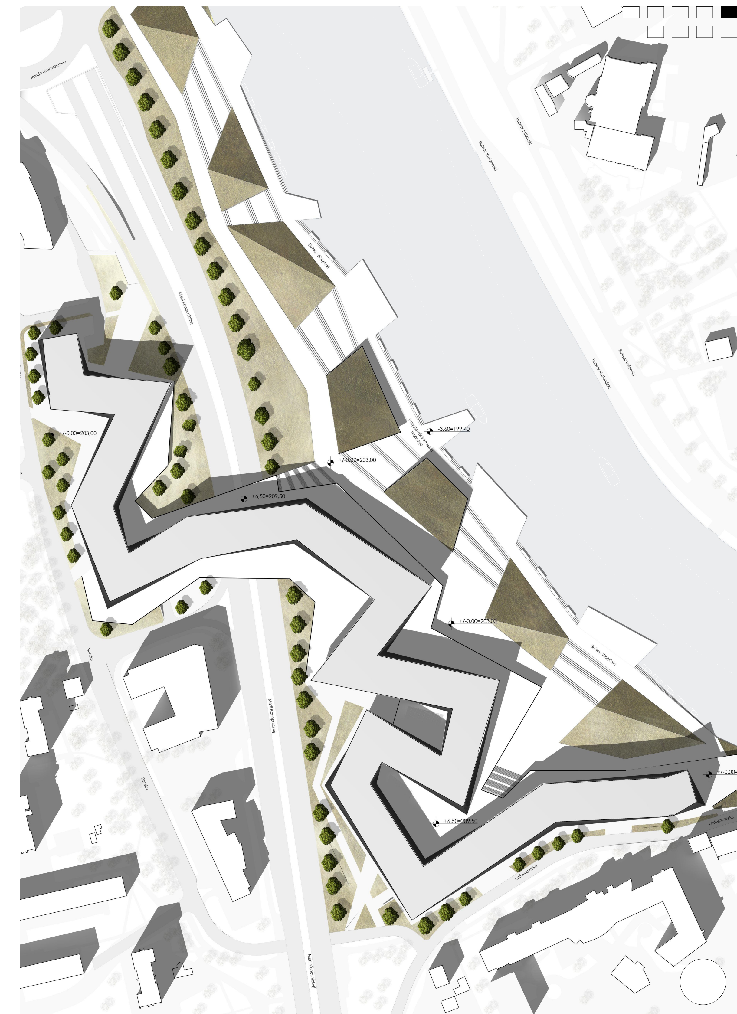
SYTUACJA SKALA 1:1500